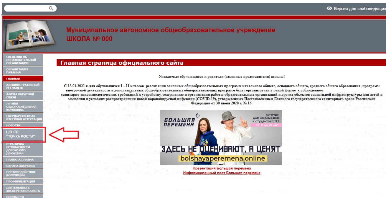
Рисунок 2. Пример размещения ссылки на раздел на сайте общеобразовательной организации

На официальном сайте общеобразовательной организации, в которой создается центр образования естественно-научной и технологической направленностей «Точка роста» (далее – центр «Точка роста», центр) в рамках федерального проекта «Современная школа» национального проекта «Образование», не позднее даты начала функционирования центра (не позднее 1 сентября года создания центра) создается раздел «Центр «Точка роста»». Ссылка на раздел размещается в главном меню сайта общеобразовательной организации и должна быть видима при просмотре каждой страницы. Ссылка не может являться вложенной в другие меню. Пример размещения ссылки на раздел «Центр «Точка роста» в меню официального сайта общеобразовательной организаций в информационно-телекоммуникационной сети «Интернет» приведен на рисунке 2.